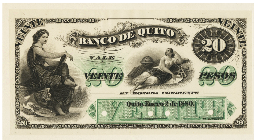
Figura 133: Banco de Quito - 20 pesos del de la ABNC (prueba)